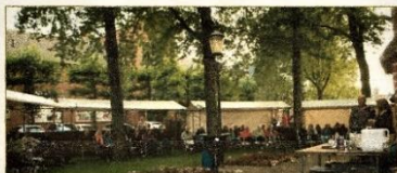
Luisterplaats bij de Zuidertoren