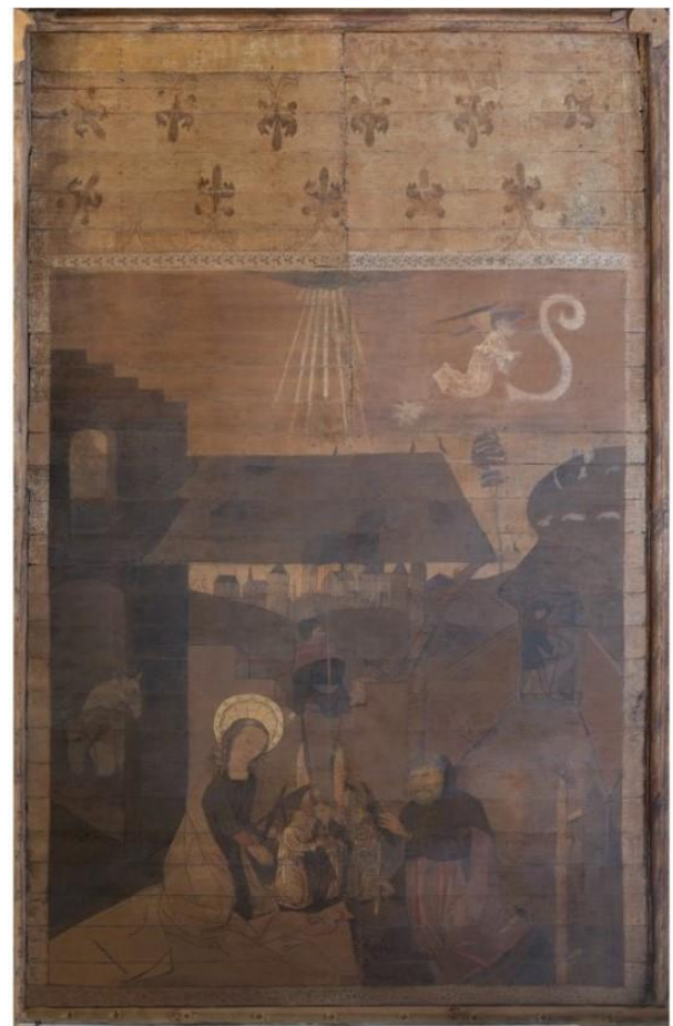
Ontstoorde en geretoucheerde foto

Wel zijn Antje en Megan druk bezig geweest om één paneel, de geboorte van Jezus, te ontstoren en te retoucheren (zie foto's).