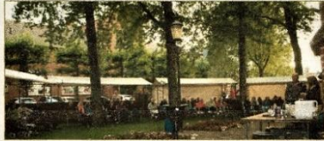
Luisterplaats bij de Zuidertoren