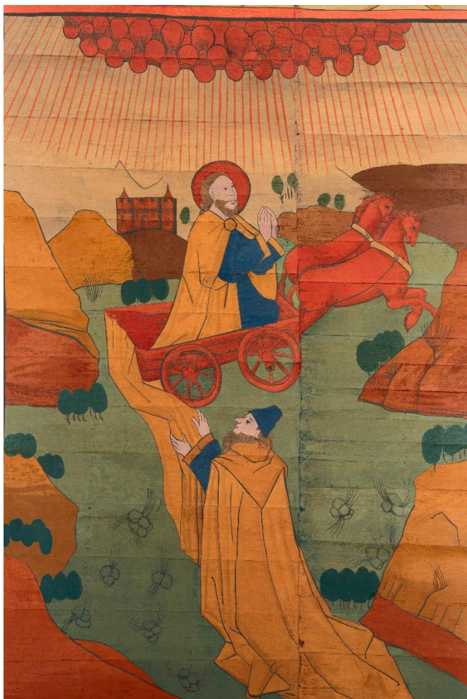
Paneel 21b De hemelvaart van Elia

Hieronder de laatste binnengekomen reconstructie.