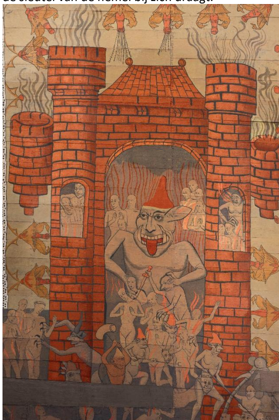
Paneel 22b Hel

Voor vrijwel alle middeleeuwse exegeten is het kerkgebouw een voorafbeelding van het hemelse Jeruzalem (Openb. 21:2 e.v.) De uitverkoren zielen komen via de poort de tempelhof binnen, waar ze ontvangen worden door Petrus die de sleutel van de hemel bij zich draagt.