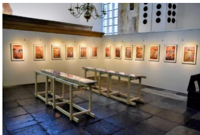
Tentoonstelling 11 mei 2025