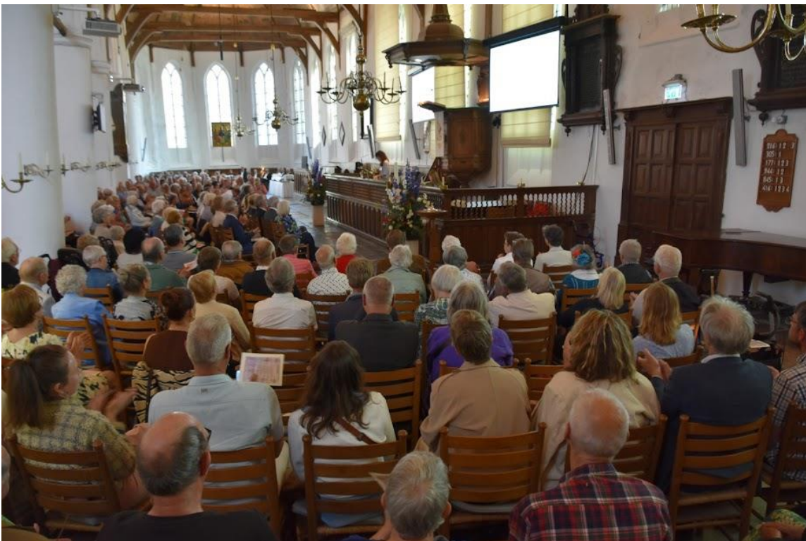
Boekpresentatie 11 mei 2025 in een volle Zuiderkerk

Met vriendelijke groet, Cees Rijnders voorz./secr. SVZK